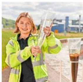
Komm in unser Azubiteam!

Gefällt dir, was du erlebt hast, dann schick uns deine Bewerbung zur Ausbildung oder bewirb dich online. https://www.azubi-pool-jena.de/ausbildung/ausbildungsberufe.html